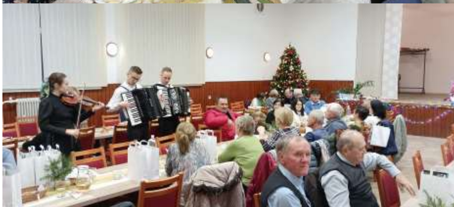
Vianočné posedenie v obci.