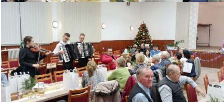
Vianočné posedenie v obci.