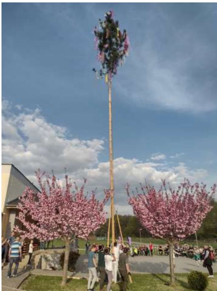
Stavanie mája 2022.