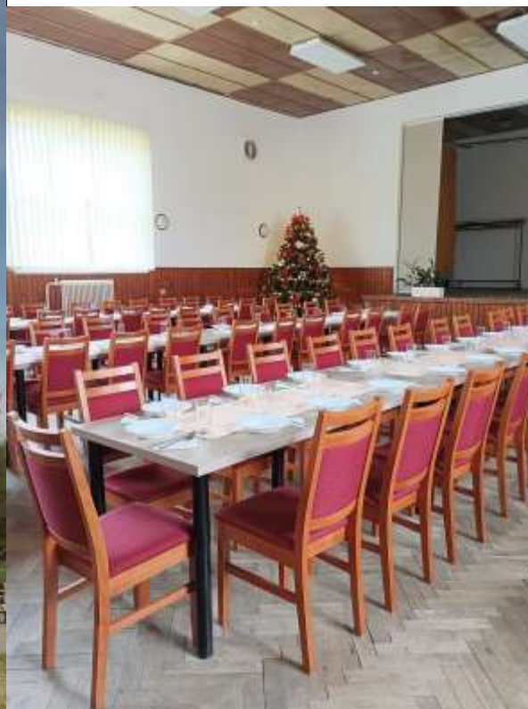
Vianočné posedenie v obci – príprava.