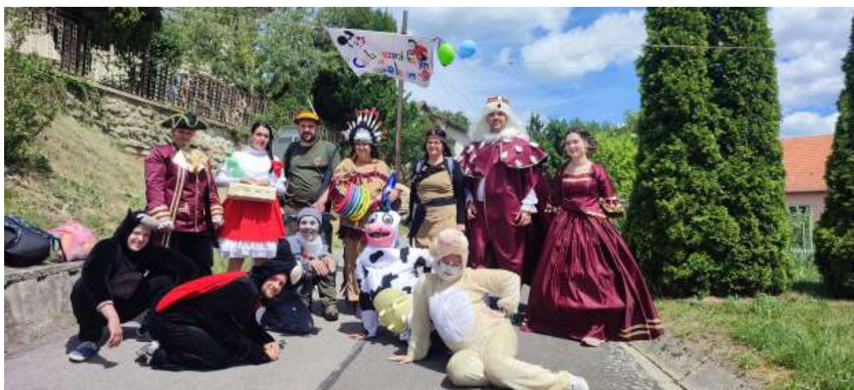
MDD 2022. Táto akcia sa teší veľkej obľube nielen deťom z našej obce, ale aj širokého okolia.

Táto výročná správa sa vyhotovuje za účtovné obdobie od 01.01.2022 do 31.12.2022.