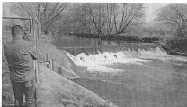
Foto 2: Pohľad na existujúci stupeň na rieke Nitra, kde bude vybudovaná hať MVE. Po ľavej strane sa nachádza areál existujúcej MVE.